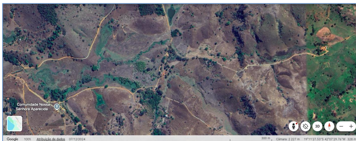
Imagem 02: Vista do local da Ponte no Córrego do Caixa Larga, local das intervenções